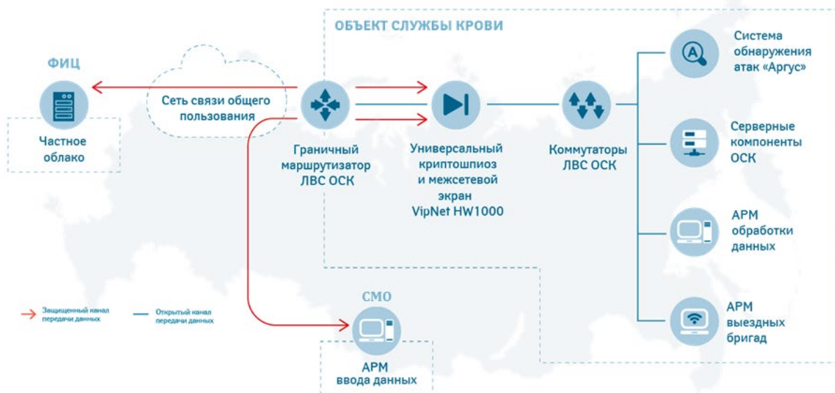
Рисунок 3 - Типовая схема объекта ЕИБД (РИЦ, СПК/ОПК)