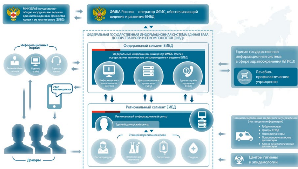
Рисунок 1 - Информационное пространство службы крови.

Место ЕИБД в организации единого пространства службы крови представлено на рисунке ниже.